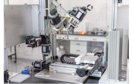
固相抽出機能を備えたハイスループット質量分析装置 Rapidfire mass system (Agilent Technologies Japan, Ltd)