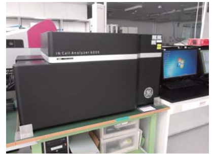
共焦点画像撮影機能を備えたイメージングサイトメーター IN Cell Analyzer (GE Healthcare)