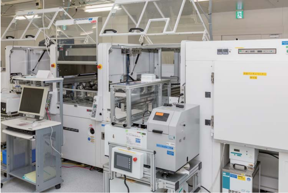
High-Throughput Screening フルオートメーションシステム HORNET HTS-10CB (FUJIFILM Wako Pure Chemical)